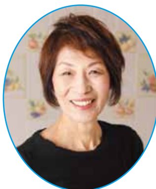
ゲスト パネリスト 浜内 千波(料理研究家)