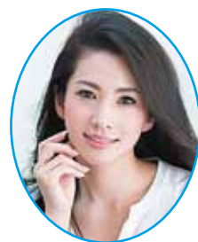
MC 柳沼 淳子 (フリーアナウンサー)