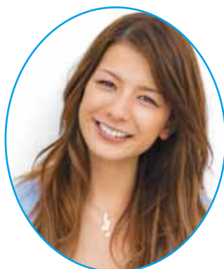
ゲスト パネリスト スザンヌ(タレント)